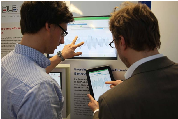
Zwei Mitarbeiter bei der Arbeit

Mehrere Mitarbeiterinnen und Mitarbeiter des Teams hatten bereits von dem Europäischen Fonds für regionale Entwicklung (EFRE) gehört und sahen darin eine der wenigen Möglichkeiten, das Projekt in Schwung zu bringen. Andere Fördermittel für solche Projekte sind rar gesät. Also hat man sich zusammengesetzt und einen Antrag beim Land Niedersachsen auf EFRE-Mittel gestellt. Eine treffendere Richtlinie zur Förderung hätte es nicht geben können: „Förderung von Innovationen und wissensbasierter Gesellschaft durch Hochschulen, Forschungseinrichtungen, Einrichtungen der Erwachsenenbildung und Berufsakademien.“