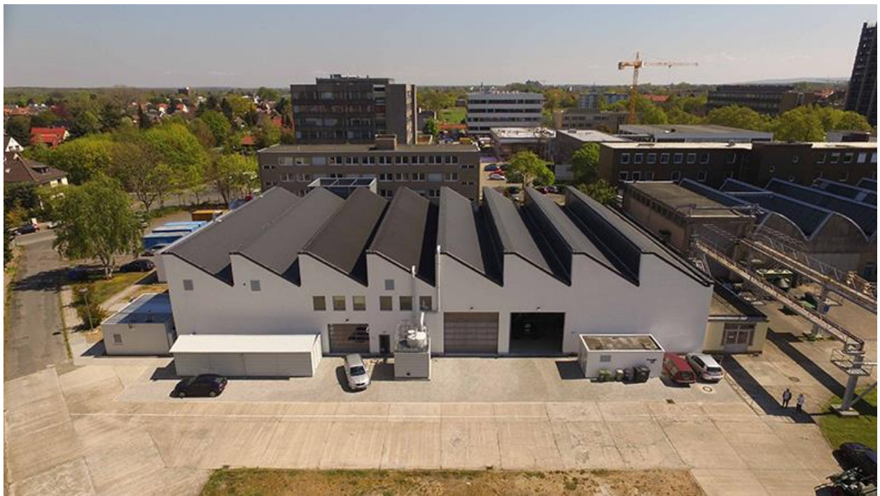
Das Gebäude der Battery LabFactory