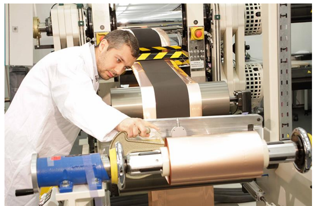
Verschiedene Schritte bei der Fertigung einer Batterie

Die Mischung macht's. Zu Beginn des Herstellungsprozesses einer Batterie wird eine Art Brei (Dispergierung) gemischt. In einem zweiten Arbeitsprozess wird die gewonnene Mischung beschichtet und verdichtet. Vier weitere Schritte sind bis zur Fertigstellung notwendig. Haselrieder vergleicht den Prozess mit dem Backen. Omas Kuchen hat immer am besten geschmeckt. Das Rezept war bekannt, aber nur Oma konnte den Kuchen so backen, wie er am besten schmeckte. Woran lag das? Hat sie doch ein bisschen mehr Zucker genommen? Hat sie den Teig länger geknetet? Hat sie ihn mit den Händen oder